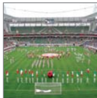
Стадион «Локомотив», г. Москва