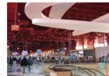
Hartah's Chester: Казино и ипподром, Пенсильвания, США

Модельный ряд R-Series состоит из 22 продуктов, которые как по отдельности, так и в любой комбинации позволяют обслужить любое публичное мероприятие, какое только можно вообразить. В этой брошюре вы можете увидеть примеры долговечных инсталляций, начиная от конференц-залов и заканчивая гоночной трассой. Большие акустические системы R-Series могут докричаться до любого уголка огромных стадионов, в то время как многочисленные малые модели помо-