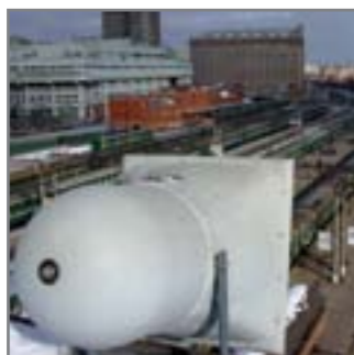
Казанский вокзал, г. Москва

Универсальные всепогодные акустические системы