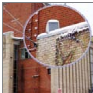
Уличное оповещение, г. Лабьтанги