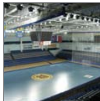
Дворец спорта «Олимпийский», г. Чехов