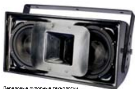
Передовые рупорные технологии