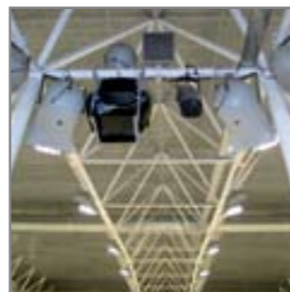
Ледовый дворец, Ялutorовск