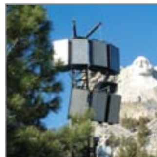
Гора Рашмор, США