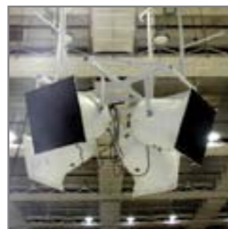
Дворец спорта, г. Тюмень