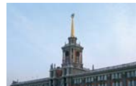
Здание Марии, г. Екатеринбург

От спортивной площадки в школе до трассы NASCAR, у Community есть правильное решение для вас. В наши дни активный образ жизни привёл к тому, что всё больше и больше событий происходит на открытом воздухе, не смотря на капризы природы. Аудио-инсталляции должны быть рассчитаны на работу круглый год. Никогда прежде круизные корабли, водные парки, парки развлечений, специ-