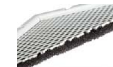
Защитные решётки WEATHER-STOP™